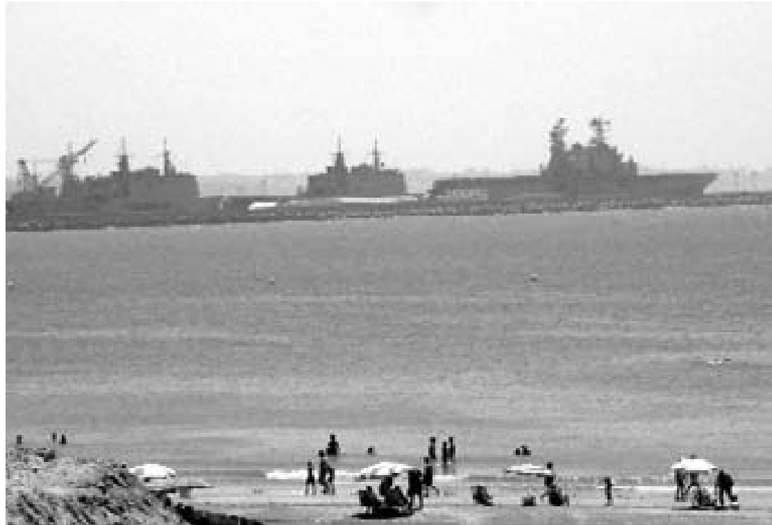
El Ayuntamiento considera que 500.000 euros no pagan los perjuicios que ocasiona la Base Naval.

A este respecto, se refirió a perjuicios tan importantes como el bloqueo del desarrollo del suelo industrial, la paralización del desarrollo urbanístico en zonas como el R-8 o el problema del pago