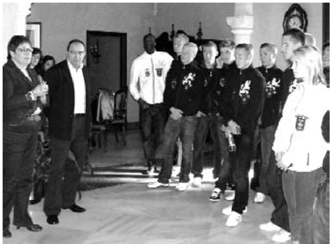
La expedición al completo en una reciente recepción ofrecida por el Ayuntamiento de Rota.

Al margen del calendario de entrenamientos, jugadores y técnicos tienen previsto realizar diferentes visitas a otros puntos de la comarca, como Jerez o Sanlúcar.