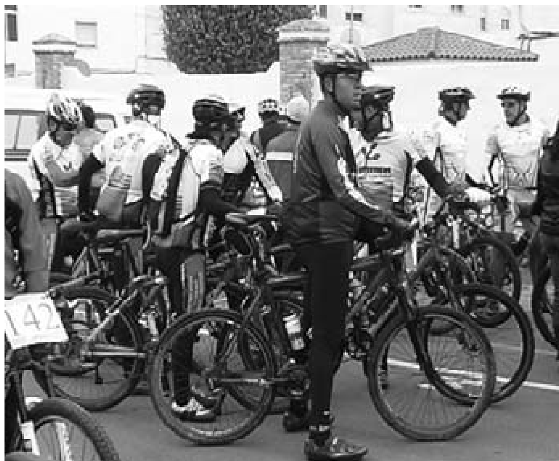
El mal tiempo alteró el recorrido de la prueba, que se caracterizó por una gran participación.