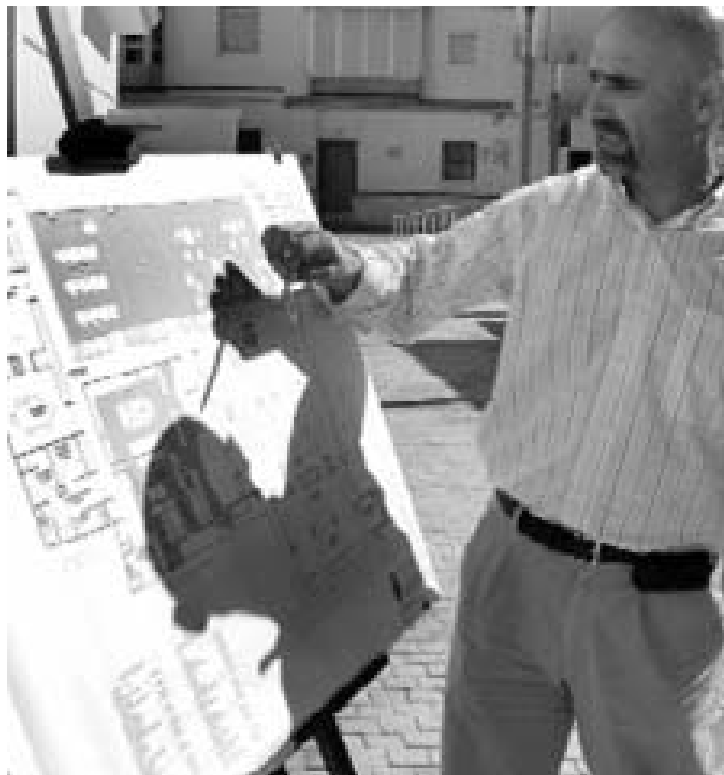
La inversión global de este proyecto asciende a 1,2 millones.

Esta zona de relación sirve también de entrada tanto al bar restaurante, como a las cuatro amplias salas que se destinarán para proyecciones,