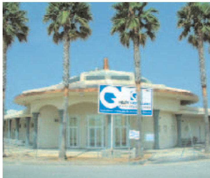
Las obras de la nueva estación ya han finalizado.

Estas dos dependencias se sumarán al importante equipamiento que el Ayuntamiento está construyendo en estos momentos a pie de playa para los servicios de