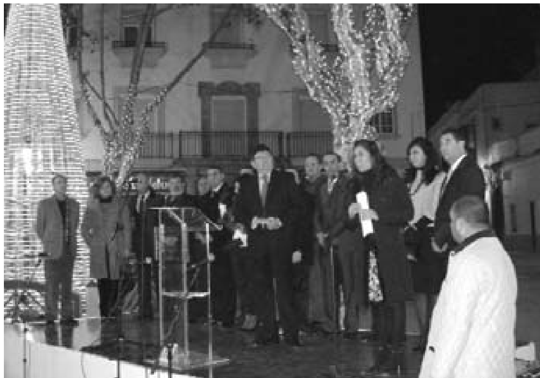
El pasado sábado 1 de diciembre el encendido del alumbrado marcaba el inicio de las fiestas.

menos, ha grabado unos siete discos, con los que ha encabezado las listas de éxitos y se ha ganado el reconocimiento de crítica y público. Lleva años afincado en Chipiona donde se ha ganado el cariño de todos los vecinos.