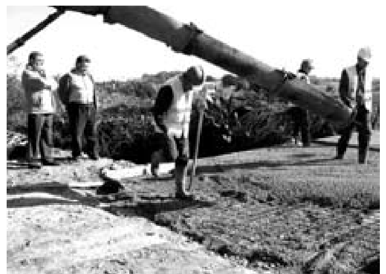
Los agricultores alertaron del peligro de la construcción.

Esta actuación, que se ha realizado a través de la empresa municipal Aremsa, ha contado con un presupuesto aproximado de 5.000 euros.