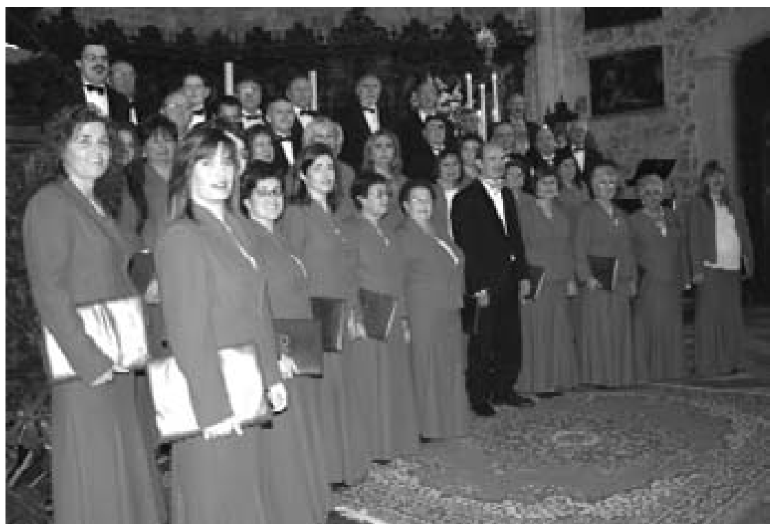
El auditorio Alcalde Felipe Benítez volvió a registrar un lleno absoluto el 1 de diciembre.