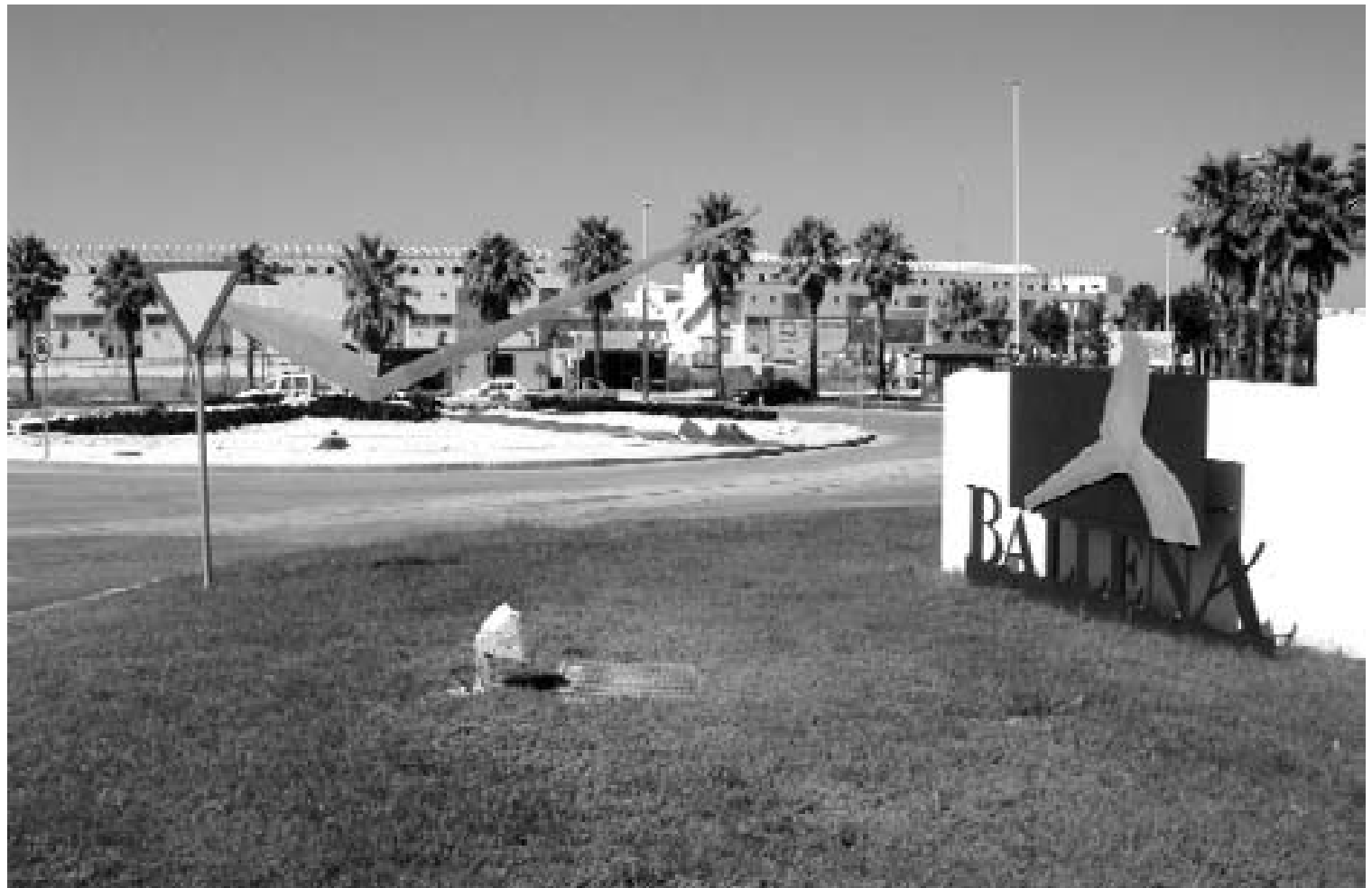
En los últimos años, este complejo turístico ha experimentado notables cambios en los que tiene mucho que ver la gestión de la EUC.

La gran implicación de la EUC No es posible recorrer Costa Ballena en todas sus coordenadas sin ver la huella continua y diaria de la EUC. Si en su día algunas voces desorientadas y equívocas pregonaron aquello de que el