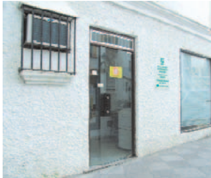
La Omic atendió en 2006 un total de 3.321 consultas.

consumidores y empresarios, derivados de los nuevos métodos de adquisición y transacciones comerciales con el uso de las nuevas