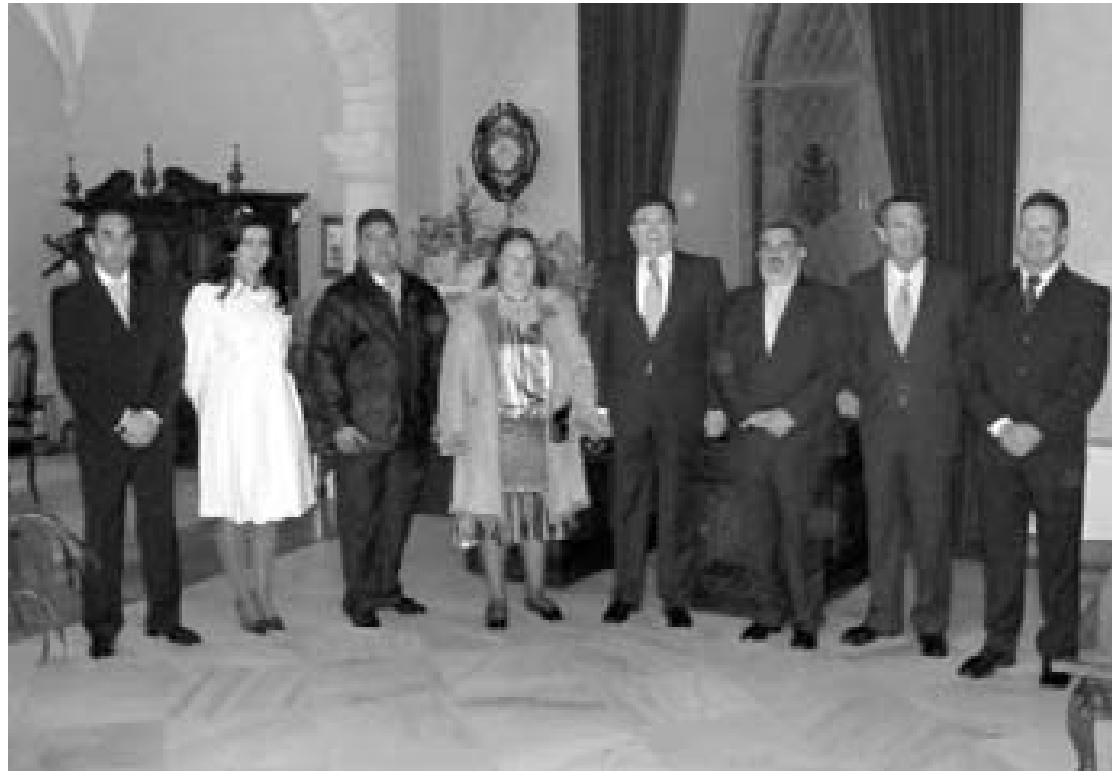
El alcalde y el delegado de Fiestas junto a los tres flamantes Reyes Magos de Oriente de 2007.

El jerezano, de 42 años, es una gran figura del cante y uno de los principales exponentes de la cultura flamenca andaluza. No es para