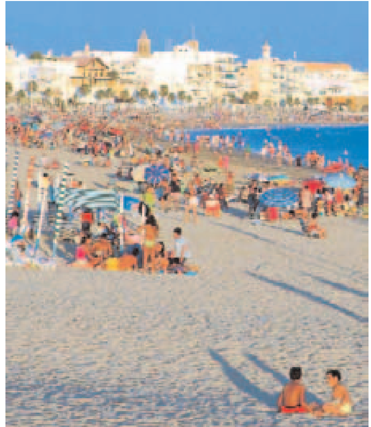
La mayor parte de los veraneantes suele regresar a Rota.

Además, según este estudio, la mitad de los visitantes llegan a prolongar su estancia hasta los 15 días, si bien un 34 % realizan una visita de un día y un 16% llega a pasar en la localidad más de quince días. Una vez en la ciudad, el 65% aprovecha para visitar municipios que se encuentran en los alrededores, y que en el 89% de los casos se traduce en localidades de la provincia, como Cádiz, Jerez y Sanlúcar de Barrameda, mientras que el restante 35% prefiere quedarse en Rota.