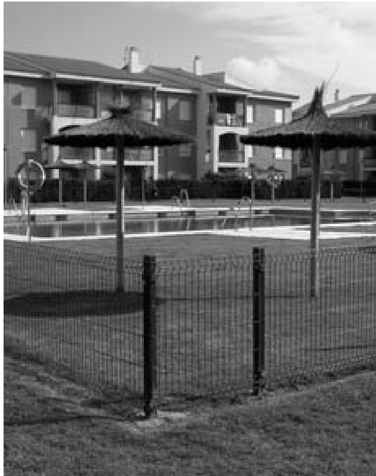
Los acontecimientos de 2005 pusieron a prueba al complejo.

Según han informado fuentes vecinales, el magistrado decidió suspender la vista en tanto no se resuelva la denuncia penal presentada ante los tribunales de Rota, tal como había solicitado la promotora.