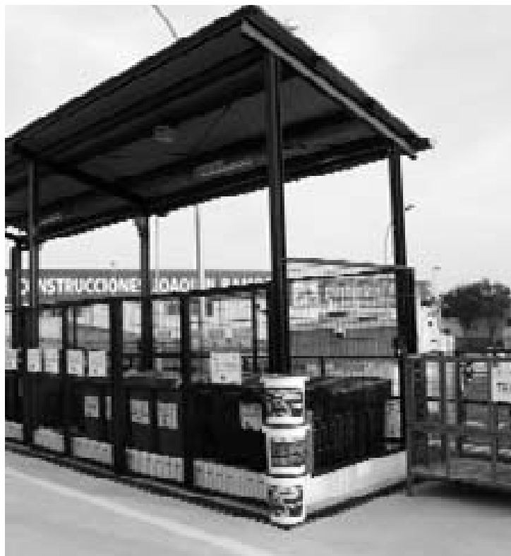
Estas instalaciones ampliaron su horario a comienzos de año.

Asimismo, las instalaciones de la calle Ganadero del polígono industrial recogieron a lo largo de este año hasta ocho contenedores de vidrio industrial. Unas cifras que constatan un aumento progresivo en el grado de concienciación de los roteños en limpieza y reciclaje.