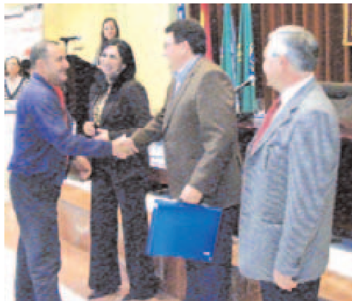
Los nuevos propietarios recibieron las llaves de manos del alcalde.

Los nuevos propietarios se mostraron exultantes al recibir las llaves de su nuevo hogar.