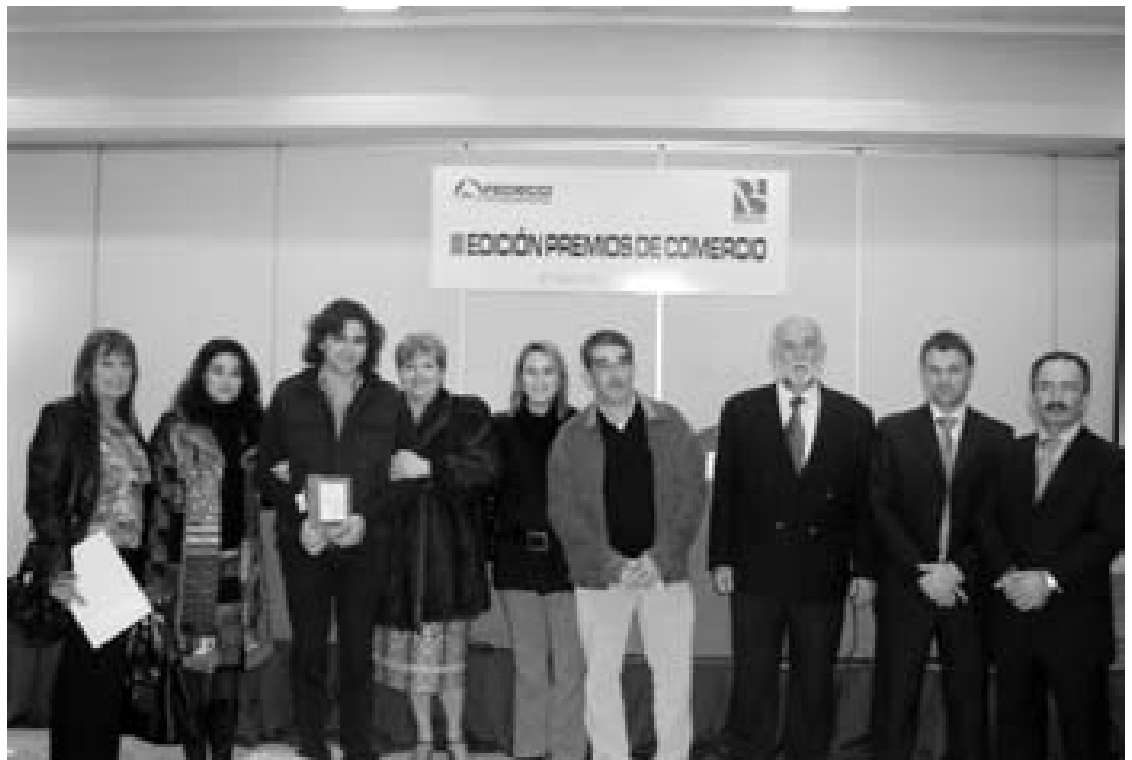
Los asistentes pudieron disfrutar entre otras cosas de delicias gastronómicas

El objetivo de los galardones impulsados por Fedeco pasa especialmente por valorar aquellas iniciativas comerciales que sean acordes con los principios de la buena práctica empresarial y que sirvan como modelo o locomotora para una continua mejora de todo lo relacionado con la actividad comercial.