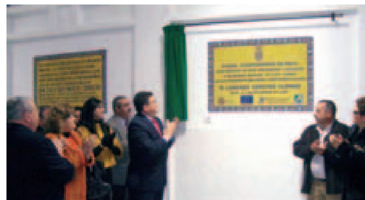
El alcalde descubrió una placa conmemorativa en el acto.

Posteriormente, gracias a un convenio con el Ministerio de Administraciones Públicas a través de Fondos Europeos, el Ayuntamiento consiguió un millón de euros, una inversión que se destinó a remodelar el interior del mercado y a la restauración de la fachada. Los trabajos también han incluido la mejora de los puestos.