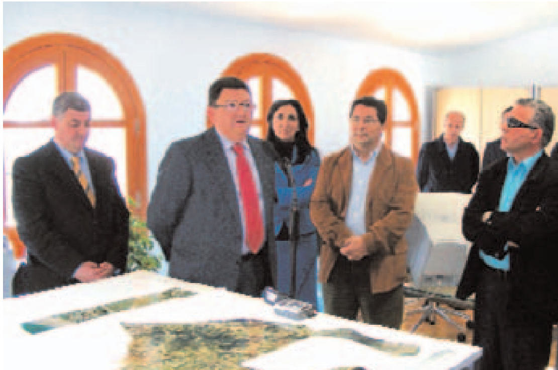
Las dependencias se ubican en un edificio que ha sido rehabilitado en la Plaza de España.

La modernidad y funcionalidad de las salas diáfanas adaptadas al trabajo en oficina en las tres plantas, y cuatro despachos individuales en planta baja y primera, así como del ascensor adaptado a personas con discapacidad, se hacen compatibles con el trabajo de recuperación de este emblemático inmueble, en el que se ha restaurado y conservado su fachada, de manera que mantiene la estética de este emblemático edificio. Además, se han creado