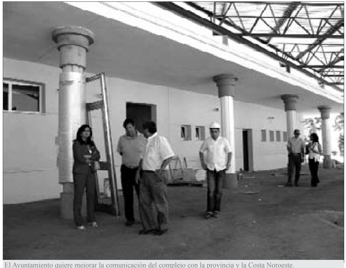
El Ayuntamiento quiere mejorar la comunicación del complejo con la provincia y la Costa Noroeste.

Al margen de que en los últimos meses se hayan llevado a cabo actuaciones como la instalación del servicio del catamarán, desde el Ayuntamiento Rota consideran que sigue estando en un "fondo de saco". En este sentido, desde la institución municipal denuncian la carencia de línea férrea, que siguen pendientes de que se culmine el anunciado Plan Más Cerca de mejora de las carreteras y el elevado coste que tienen los transportes públicos respecto a otras zonas cercanas.