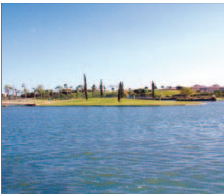
La frontera entre Rota y Chipiona está fijada a través del canal del lago.

En este sentido, abogó por “abrir una vía de diálogo” y por el “sentido común”, especialmente teniendo en cuenta las buenas relaciones que hasta ahora han existido siempre entre las dos localidades vecinas, y que se han traducido en colaboraciones en temas de limpieza, de policía, de depuración de aguas, etc. De igual manera, tras redundar en la “excelente relación de amistad” que mantiene con el alcalde chipionero, el edil independiente dejó claro que “ni hemos usurpado nada, ni le hemos quitado nada a nadie, ni es intención de este alcalde ni del equipo de Gobierno, ni de la corporación Municipi-