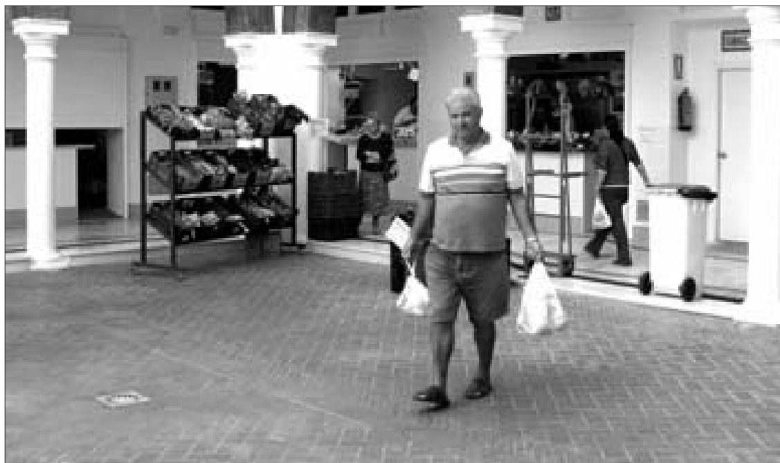
El Consistorio ha abierto el proceso para adjudicar la reforma de los puestos, presupuestada en más de 70.000 euros.

Las obras de acondicionamiento, que cuentan con un plazo de ejecución de ocho meses, afectarán a varios puestos de car-