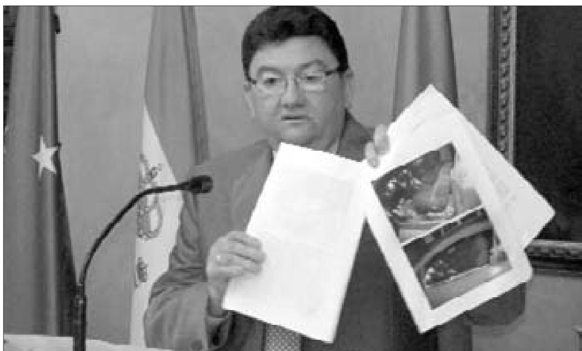
El alcalde de Rota muestra las fotografías del estado en el que quedó el coche del concejal popular.