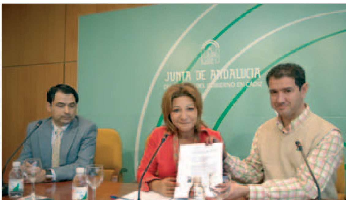
La delegada provincial de Innovación entregó de forma simbólica la resolución de la Junta al alcalde de Chipiona.

En la actualidad, en la provincia hay otras seis estaciones de ITV en Cádiz, Puerto Real, San Fernando, Villamartín, Algeciras y Jerez. En 2006, las estaciones que cubren los servicios