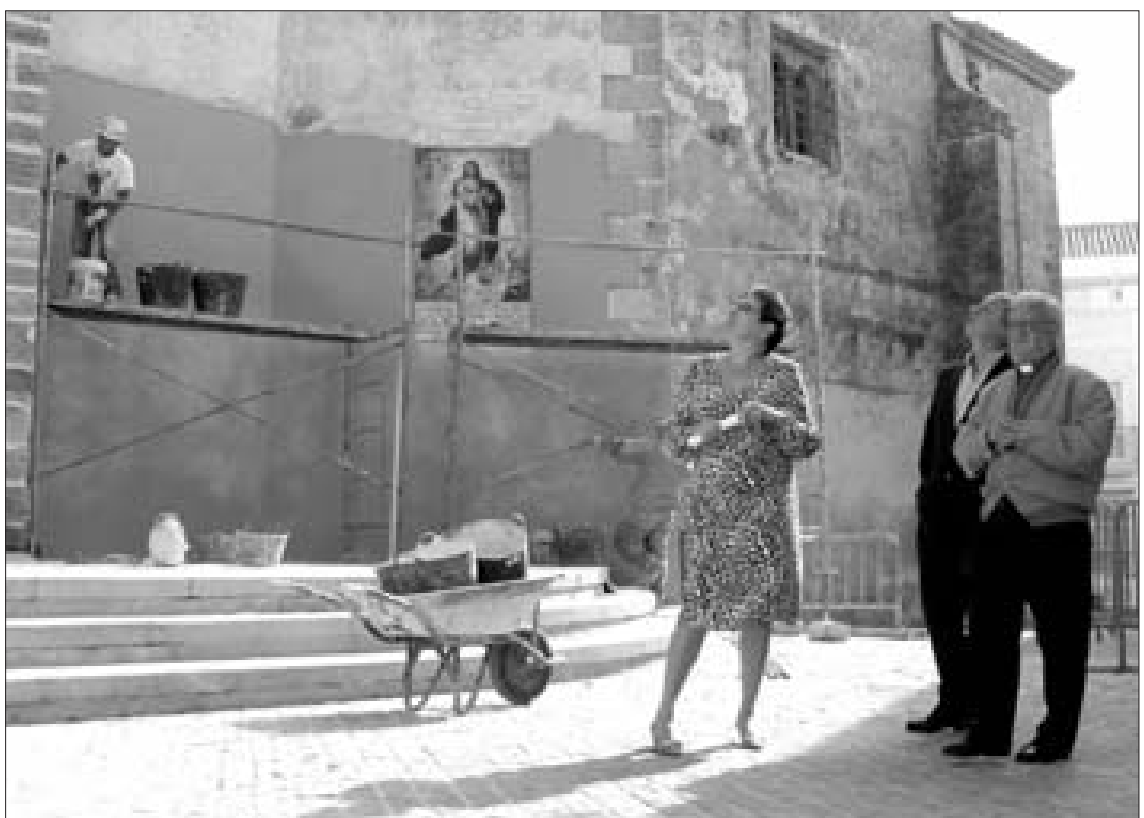
Las obras se realizaron en virtud del acuerdo que el Ayuntamiento de Rota mantiene con el Obispado.

No obstante, aparte de estos trabajos, la comisión de seguimiento que se ocupa del cumplimiento de dicho acuerdo de colaboración, en el que se recoge una dotación de 300.000 euros, resolvió también llevar a cabo labores de mantenimiento y adecentamiento de la cubierta y el acceso a la escalera del emblemático templo roteño. El presupuesto para estas nuevas actuaciones será de más 11.000 euros.