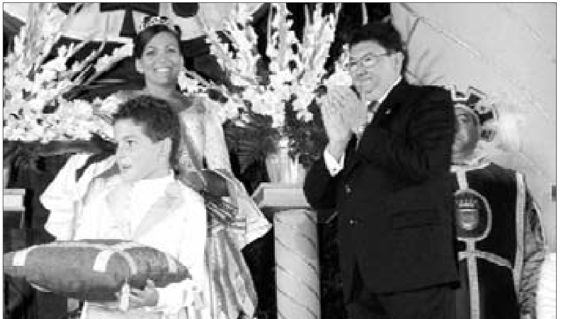
La coronación de la Dama Mayor fue otro de los momentos más emotivos.