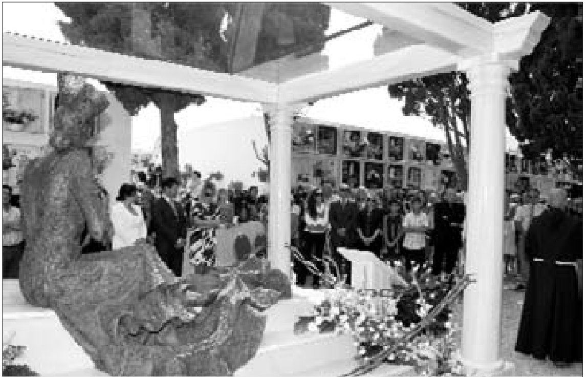
Los chipioneros están indignados por el reconocimiento que los populares quieren hacer a su chipionera más internacional.

Por su parte, Juventudes Andalucistas también ha mostra-