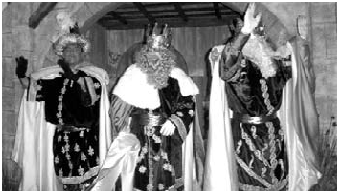
El Ayuntamiento de Rota da opción a los ciudadanos anónimos a encarnar a uno de los Reyes Magos.