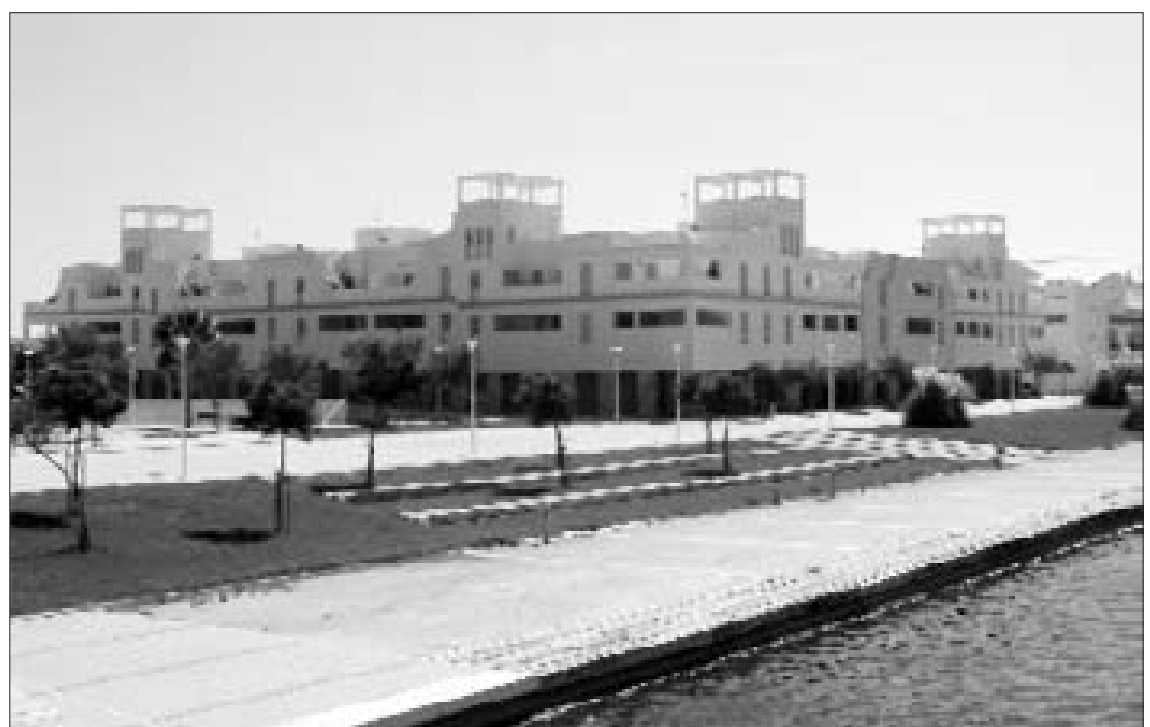
Estas mejoras pretenden acabar con los problemas de abastecimiento de Rota y Costa Ballena.

Aparte de este proyecto, cuya ejecución ya ha sido encargado a la empresa Aremsa, Rota y el complejo de Costa Ballena también se beneficiarán en un futuro