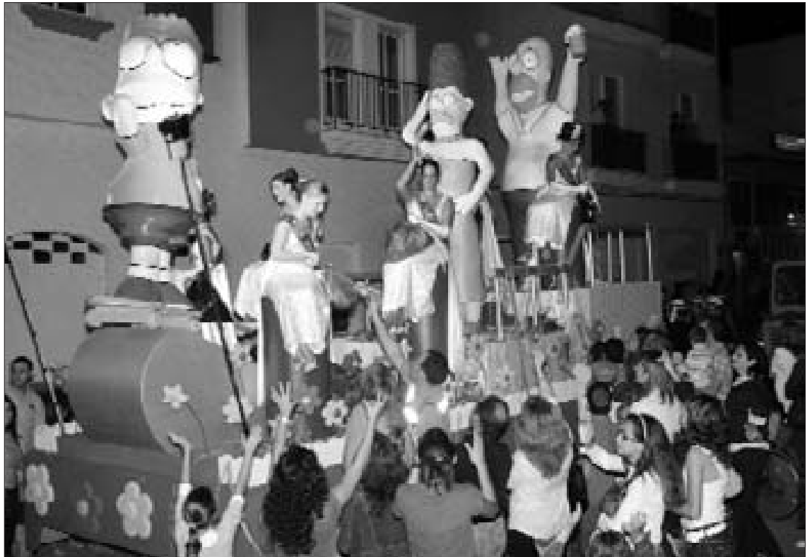
Un año más la gran cabalgata fue uno de los actos más multitudinarios.

Además de la entrega que año tras año demuestra el pueblo de Rota, si hay una característica que pueda definir estas fiestas esa es la variedad y la selección de los actos. Y es que la nutrida agenda continuó, como ya es habitual, el viernes, fiesta local, con la celebración de la VI Parada Hípica, el sábado con la Exhibición Estática de Aeromodelismo y la Gran Cabalgata por la tarde, uno de los momentos estelares de esta apretada agenda. Sin lugar a dudas era otro de los días fuertes, y el ex triunfante onubense Manuel Carrasco era el encargado de poner el broche de oro con un multitudinario concierto en la avenida San Juan de Puerto Rico.