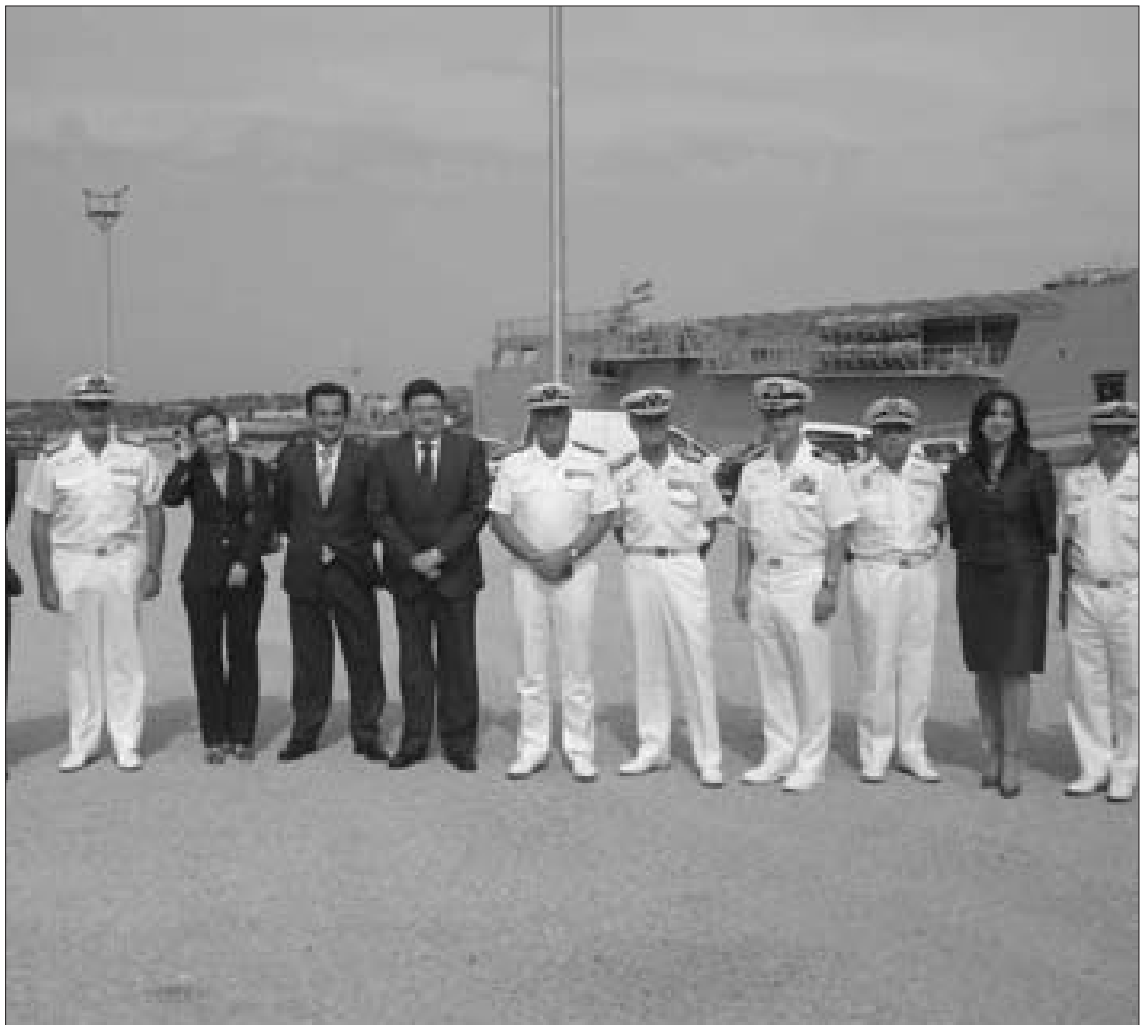
El alcalde de Rota, acompañado por miembros del equipo de Gobierno, y el jefe de la Base Naval.

Por su parte, los trabajos del proyecto del muelle 4, que en un futuro acogerá al nuevo portaviones Juan Carlos I (que actualmente se ejecuta en El Ferrol) tienen una duración de 27 meses, y supondrán el dragado de más de un millón de metros cúbicos, y la realización de escolleras y rellenos de 298.276 metros cúbicos, así como la colocación de 32 cajones de hormigón armado.