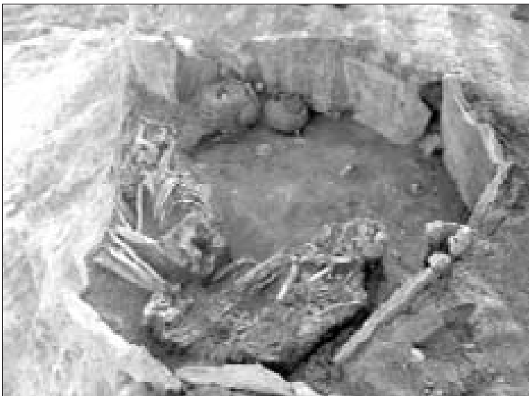
Los restos fueron encontrados durante las obras de la carretera de Munive.

No obstante, conscientes de la necesidad de valorar y conocer a través de expertos el valor histórico y la importancia que