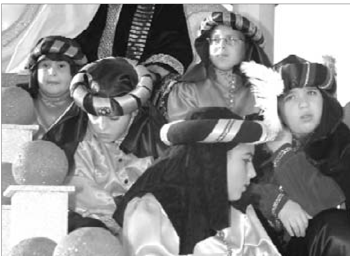
Los más pequeños son los protagonistas indiscutibles de la Cabalgata de los Reyes Magos.

Se elegirá en total a 15 pajes de entre todos los aspirantes mediante un sorteo que se realizará ante los medios de comunicación y que será supervisado por el secretario del Ayuntamiento. Los seleccionados deberán atenerse a las directrices y normas de funcionamiento, es decir horarios o vestimenta, entre otras cosas, marcadas por la Delegación municipal de Fiestas.